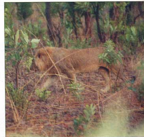
« Au Cameroun, nous avons des sujets tout à fait remarquables. »

dans des zones où les températures peuvent être plus fraîches. D'où, sans doute, les grands mâles d'Afrique australe, et autrefois ceux de l'Atlas.